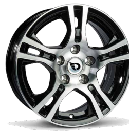
Alufelgen 14' Alle, außer Roadster 255