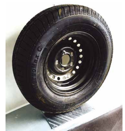
Reserverad + halterung Alle