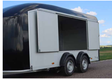
Seitliche Doppeltüre Für Roadster 800 und Roadster 900