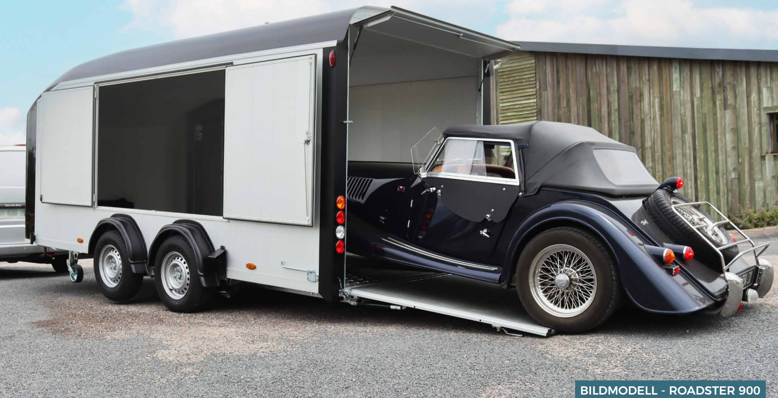
BILDMODELL - ROADSTER 900