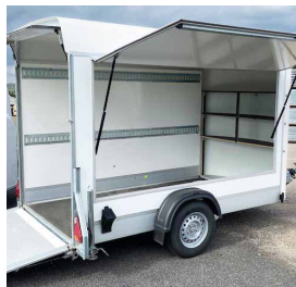
Innenausrüstung auf Wunsch Auf Wunsch, Fragen Sie gerne Ihren Debon-Fachhändler in Ihrer Nähe