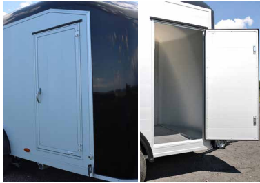
Seitentür mit Schlüsselverschluss Alle