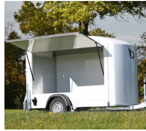
Seitenklappe Roadster 300 und Roadster 500