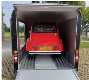
Auffahrtschiene Roadster 800 - Länge 3600 mm Roadster 900 - Länge 4500 mm